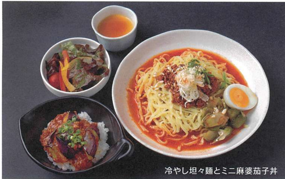
冷やし坦々麺とミニ麻婆茄子丼