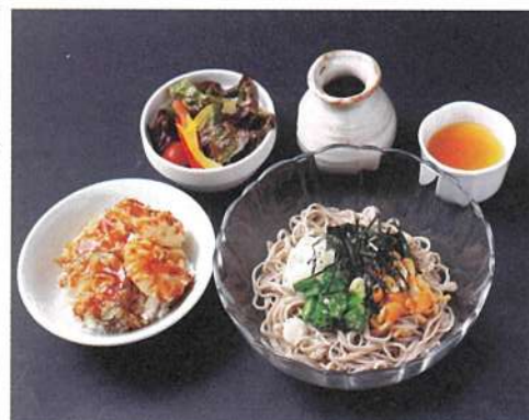
ぶっかけそばとミニ海老天丼 (うどんに変更可能です)