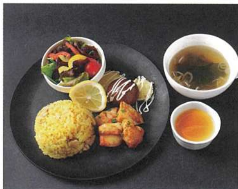
ドライカレーとタンドリーチキン